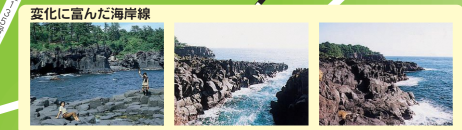
変化に富んだ海岸線

はしがかり 風波の侵食により城ヶ崎海岸はさまざまな様相を呈していますが、脚下に自然が自ら作り出したとさえ思われる石橋があります。古くから「橋がかり」と呼び伝えられているのです。大室山より流出した溶岩と風波の対決場所として珍しい自然現象の一つです。